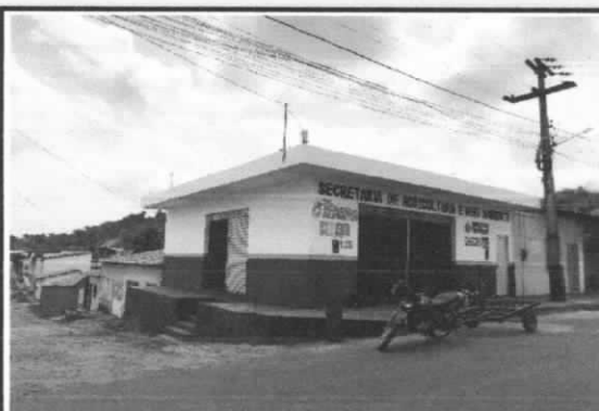
FOTO 03 - ENTRADA SECUNDÁRIA - ESQUINA