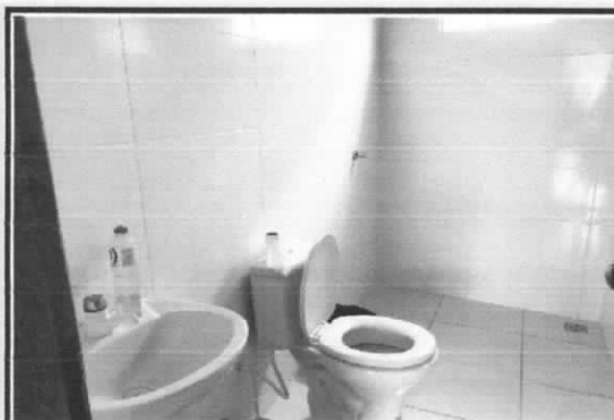
FOTO 06 - BANHEIRO SOCIAL