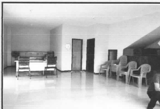
FOTO 04 - SALÃO INTERNO