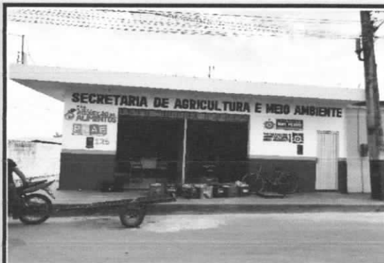
FOTO 02 - FACHADA FRONTAL